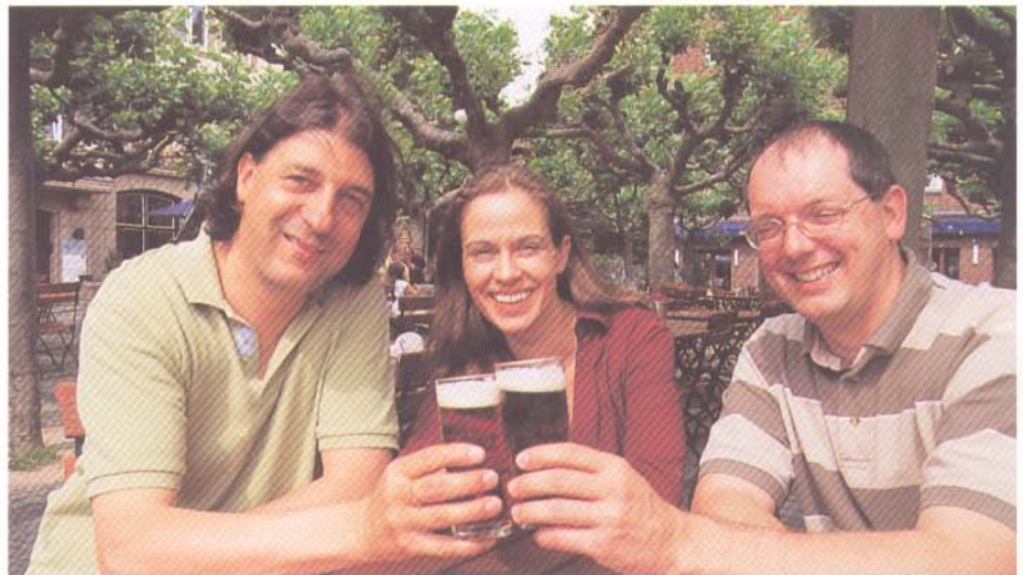
Alt-bewährt: Auf eine erfolgreiche Zukunft!