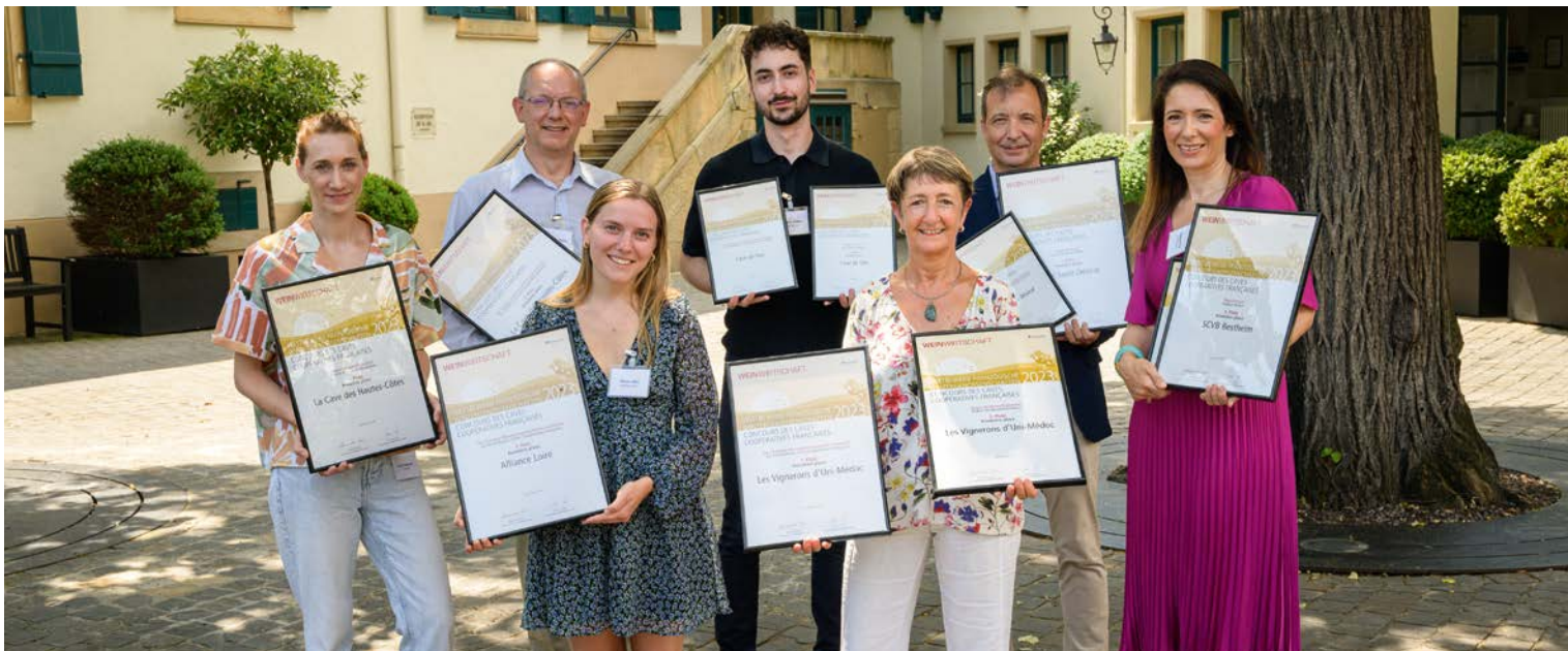
Strahlende Gesichter bei der Preisverleihung in Deidesheim